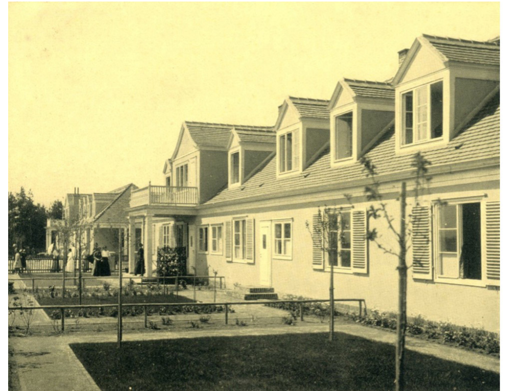
Pensionshäuser am Festspielhaus, Postkarte, um 1912

In Kooperation mit dem Deutschen Werkbund Sachsen e.V.