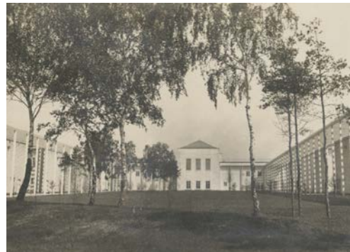
Landesschule Klotzsche, Gartenhof mit Aula, Foto um 1930