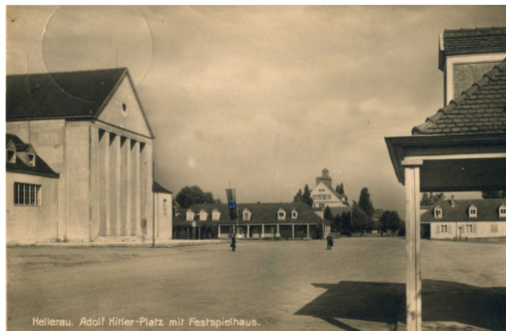
Festspielhaus, Postkarte, um 1940