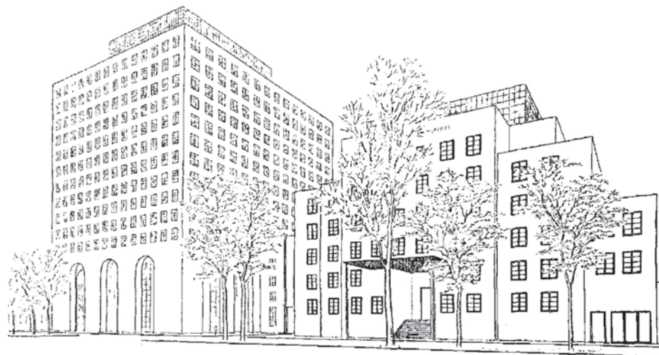
Entwurf für den Dresdner Anzeiger, 1925

In Kooperation mit dem Zentrum für Baukultur (ZfBK)