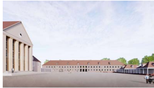
Ostflügel des Festspielhauses Hellerau, Visualisierung HeinleWischer

In Kooperation mit dem Architekturbüro heinlewischer